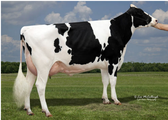
SYNERGY UNO POT O GOLD GRANDDAM